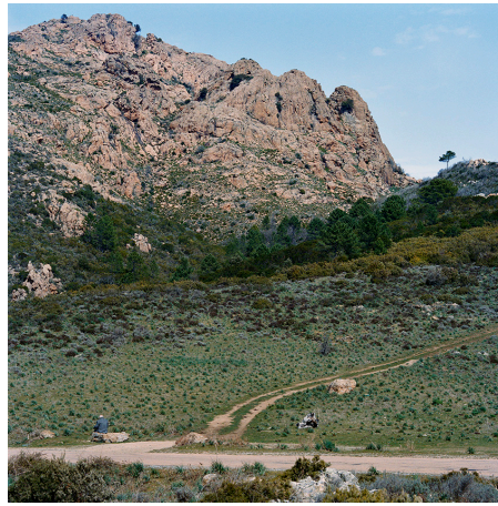
Col de Sio. Nom de code " FOUINE " lieu de parachutage d'armes à 4 heures de marche du Hameau des Martini.