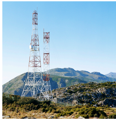
Col de Teghime : combats meurtriers contre les Allemands, pour la Libération de la Corse du 1 er au 3 octobre 1943.