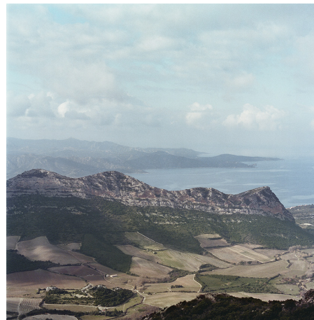
Plaine de Patrimonio et désert des Agriates (baie de Saint-Florent).