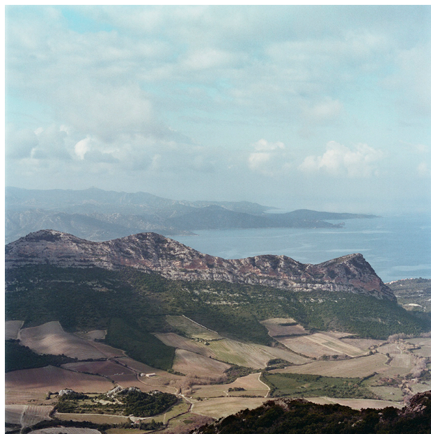
Plaine de Patrimonio et désert des Agriates (baie de Saint-Florent).